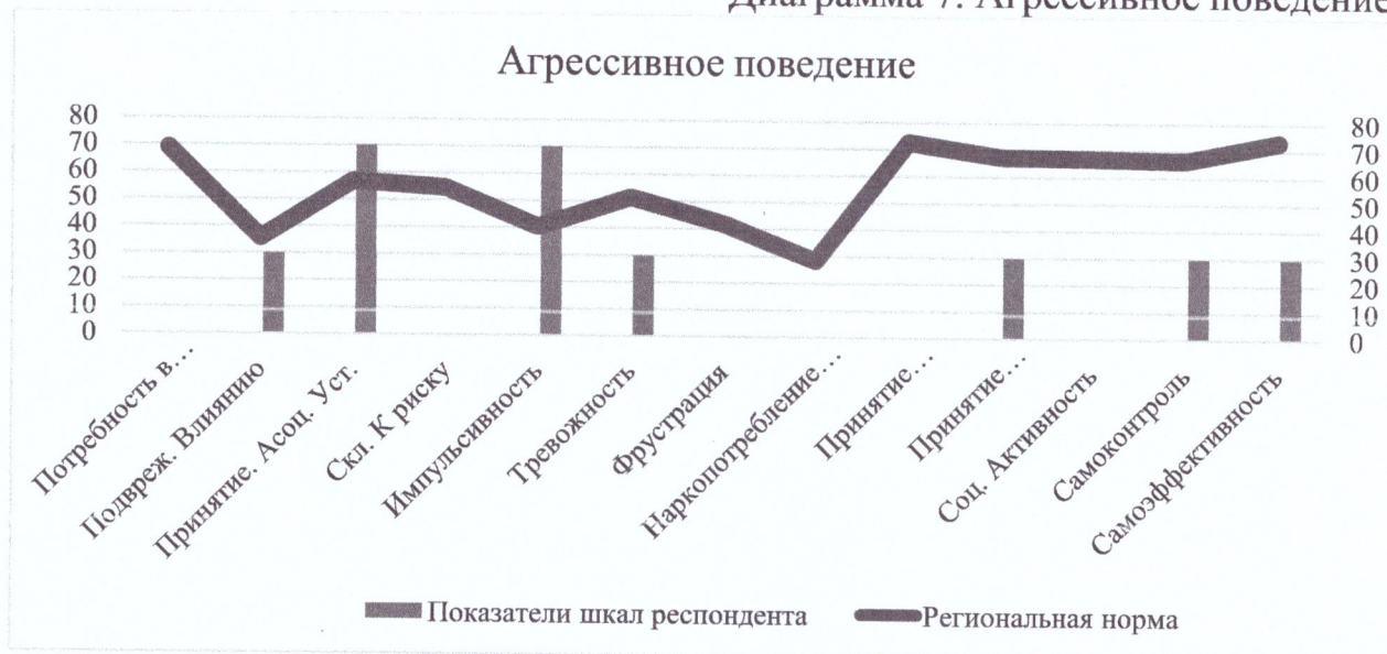
Диаграмма 7. Агрессивное поведение

т.к. она будет указывать будет ли респондент действовать в одиночку или под влиянием референтной группы.