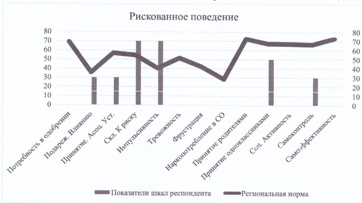
Диаграмма 3. Рискованное поведение

Если при этом выше региональных норм повышаются значения шкалы «Принятие асоциальных установок социума», то рискованное поведение может принимать форму мелких правонарушений.