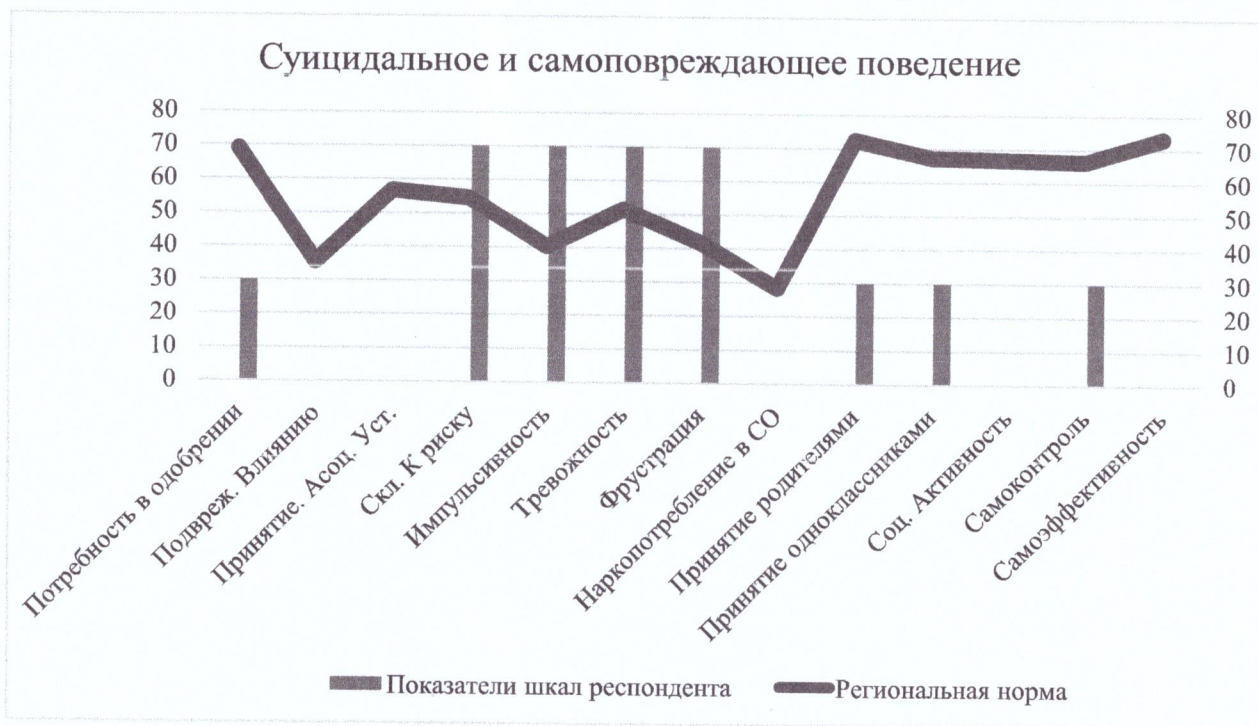
Диаграмма 4. Суицидальное и самоповреждающее поведение

неблагоприятных факторов. Данное сочетание шкал является ключевым для диагностики суицидального и самоповреждающего поведения обучающихся.