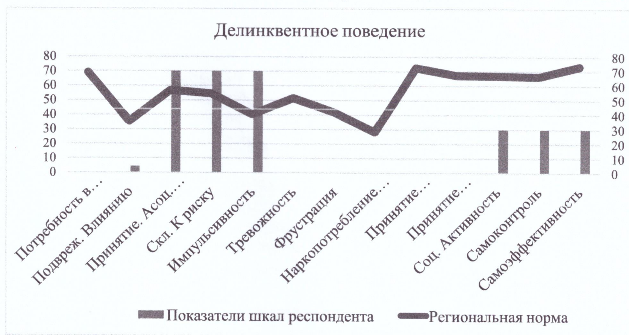
Диаграмма 6. Делинквентное поведение

Признаком делинквентного поведения могут служить высокие значения шкал «Принятие асоциальных установок социума», «Склонность к риску», «Импульсивность» в сочетании с низкими значениями шкал (как одной, так и нескольких) «Самоконтроль поведения», «Социальная активность», «Самозффективность» и «Тревожность» (см. Диаграмма 6). К этому сочетанию могут добавляться низкие значения шкал (вместе или по отдельности) «Принятие одноклассниками» и «Потребность в одобрении». Также необходимо при наличии указанного выше сочетания шкал обращать внимание на значения шкалы «Подверженность влиянию группы» т.к. это может говорить о том следует ли респондент за мнением референтной для него группы или действует самостоятельно.