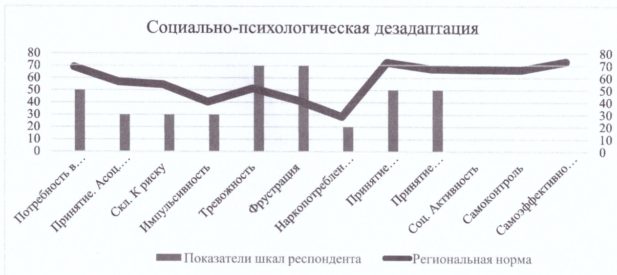
Диаграмма 1. Социально-психологическая дезадаптация

При таком сочетании шкал необходимо обратить дополнительное внимание на показатели шкал «Принятие родителями» и «Принятие одноклассниками» т.к. низкие значения могут говорить о причинах дезадаптации (проблемы во взаимоотношениях с родителями или одноклассниками соответственно).