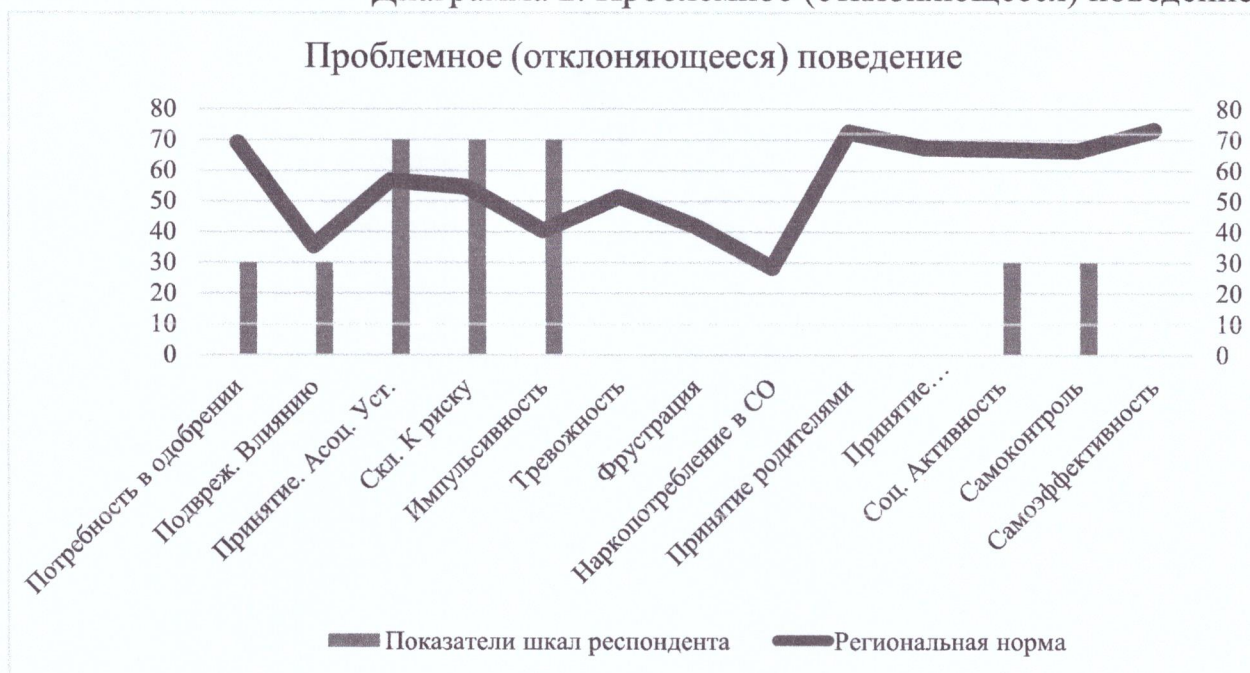
Диаграмма 2. Проблемное (отклоняющееся) поведение.

Если при этом значения шкал (или одной из них) «Социальная активность», «Самоконтроль поведения» и «Потребность в одобрении» ниже региональных норм, то вероятность проявления отклоняющегося поведения будет увеличиваться 1 .